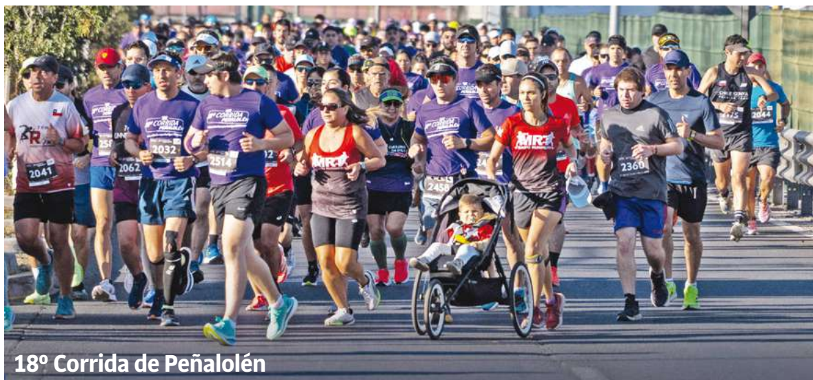
18° Corrida de Peñalolén