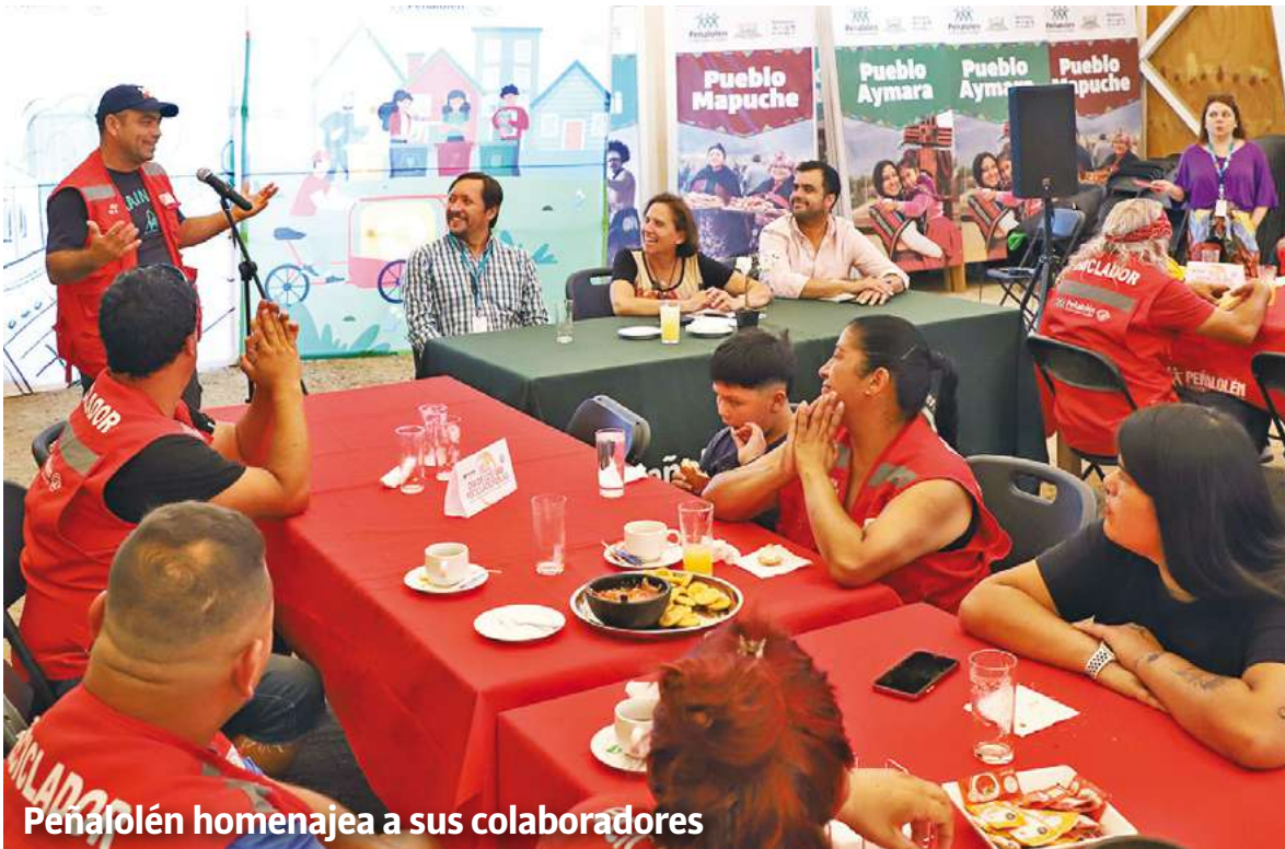
Peñalolén homenajea a sus colaboradores